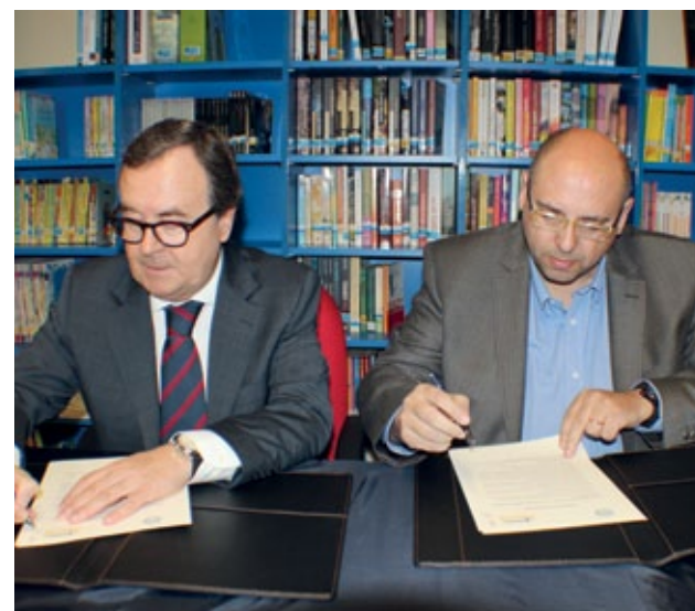
Em Macau foi assinada uma parceria com a Escola Portuguesa

quer no seu próprio desenvolvimento, quer numa perspetiva colaborativa com as instituições de ensino superior portuguesas e europeias, o Ensino Magazine está presente nos Países Africanos de Língua Oficial Portuguesa (Palop's), mas também em Macau, com distribuição da