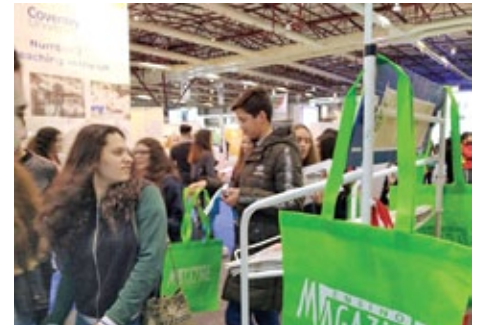
O Ensino Magazine irá ser distribuído gratuitamente aos visitantes do certame

Este ano sobre o tema “Economia Circular – Porque Tudo Acaba Onde Começa”, o intuito é reforçar o debate, a inspiração,