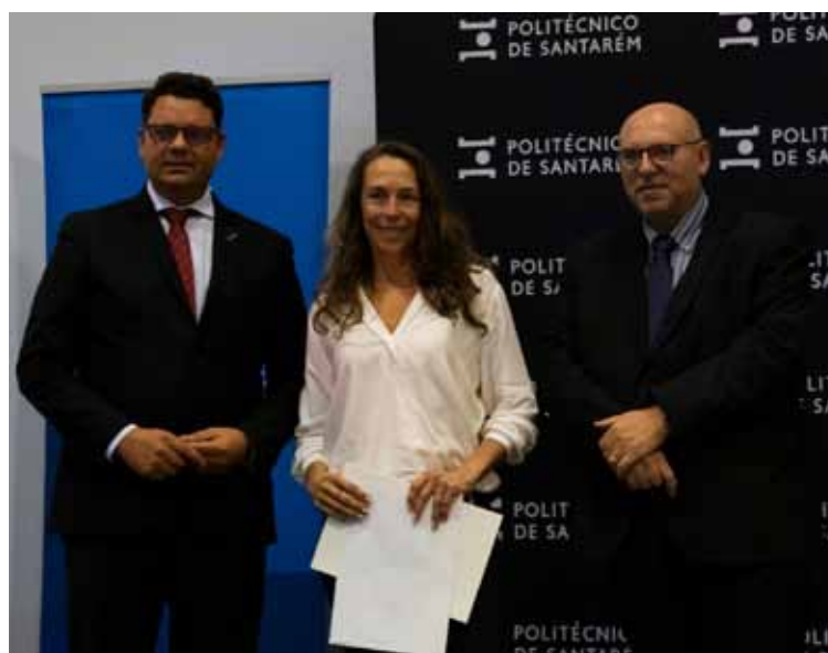
Ensin Magazine entrega prémio

exaltar os valores que a Sra. Ministra personifica, servindo de inspiração para todos os quanto lutam por uma sociedade mais justa e igualitária, onde homens e mulheres têm as mesmas oportunidades”. ■