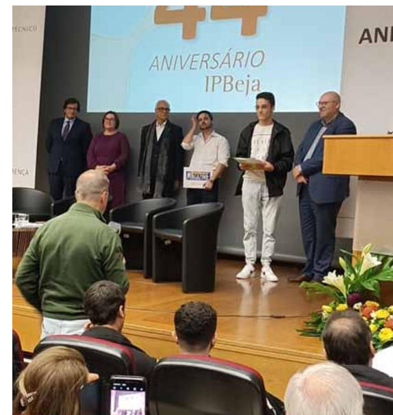
Ensino Magazine entregou duas bolsas