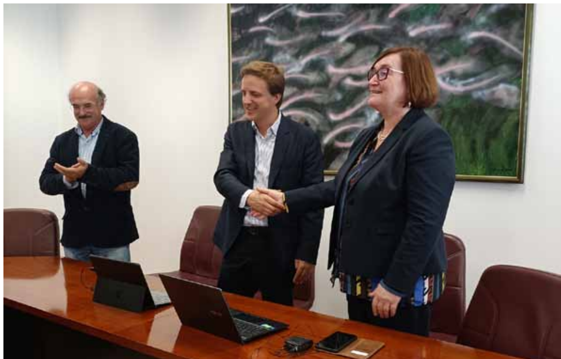
A empresa Casais e o IPBeja assinaram o contrato para a nova residência

estudantes e terá todas as comodidades e valências que uma comunidade estudantil precisa”,