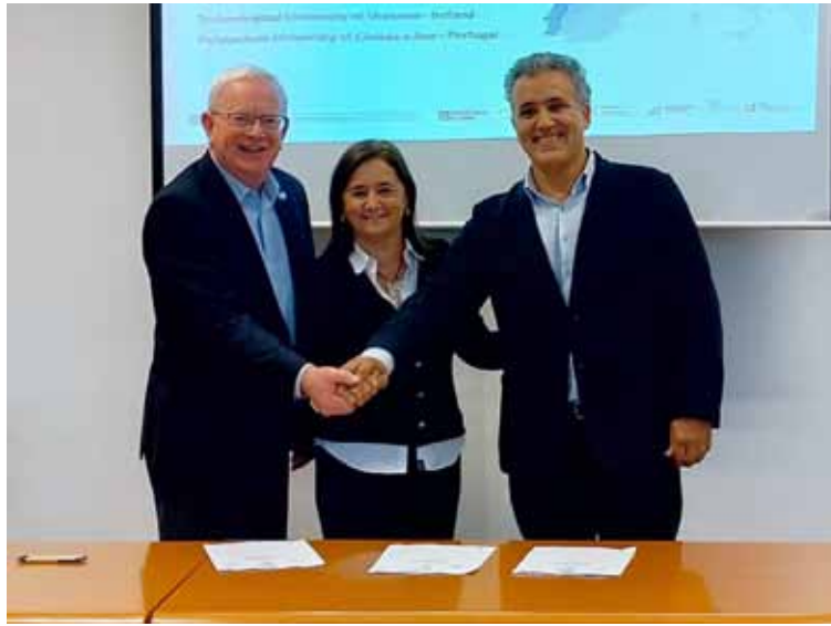
A assinatura dos acordos decorreu no IPCA