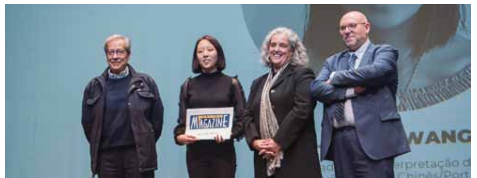
O Ensino Magazine atribuiu uma bolsa de mérito a uma das melhores alunas