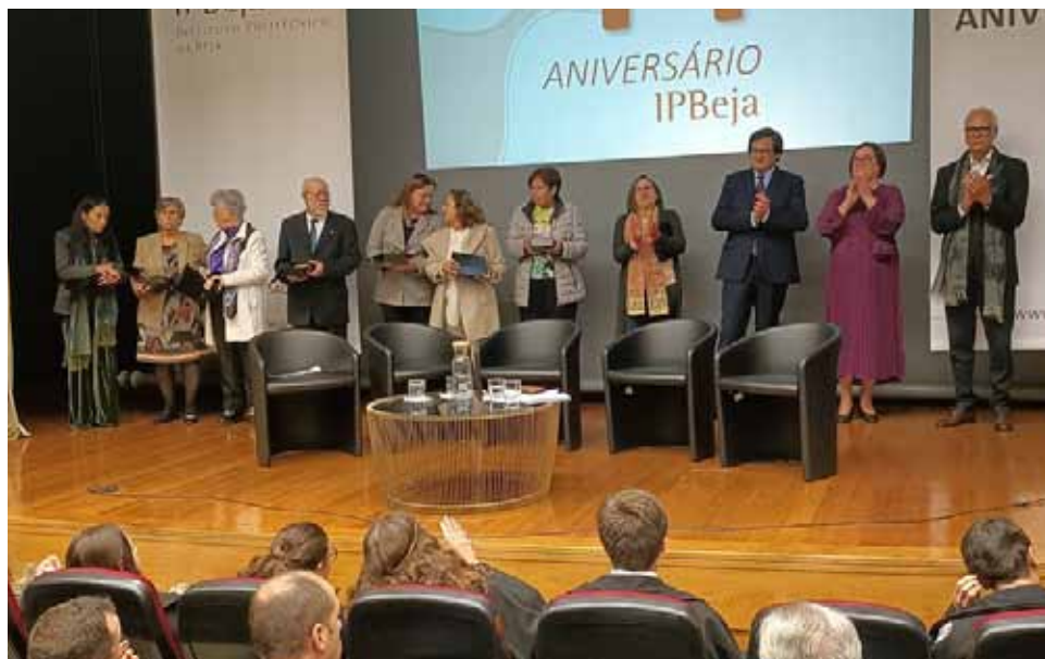
IPBeja distinguiu os funcionários

O Instituto Politécnico de Beja tem, neste ano letivo, cerca de 3200 alunos. ■